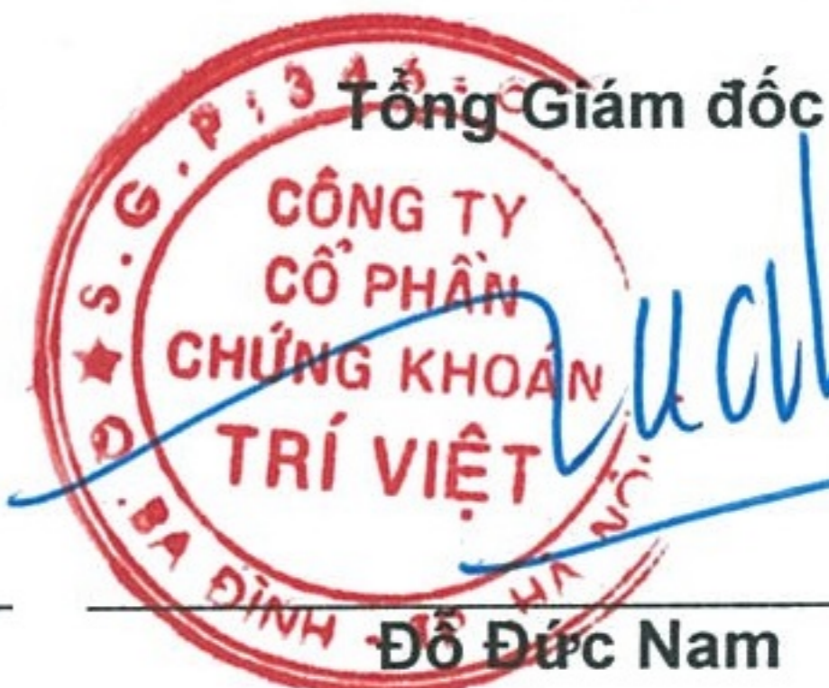
Tổng Giám đốc