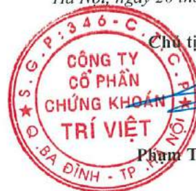
Lương Thu Phương